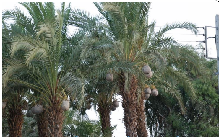
میچ سند در فصل هامین

یا طناب حصیری که چیلک (čillek) نام دارد، به شاخه‌های بالاتر درخت خرما می‌بندند.