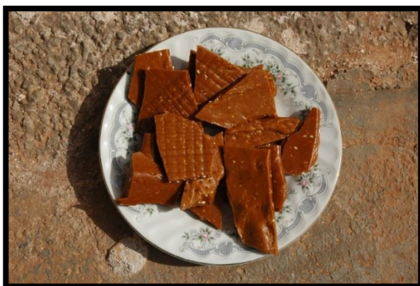
تصویر ۱. چیکو

شود. در این هنگام حدود یک لیتر شیر به آن می‌افزایند تا لور بیشتری به دست آید. پس از متراکم شدن ماده سفید رنگ حرارت را قطع کرده و پس از چند دقیقه، مخلوط لور و لور او ۱ را به کمک آبگردان در داخل کیسه سفیدی ۲ می‌ریزند. تا آب آن کاملاً خارج شود، آب خارج شده را لور/وی می‌نامند. ماده باقی مانده داخل کیسه را لور می‌نامند. لور معمولاً با افزودن مقداری نمک به صورت تازه مصرف می‌شود.