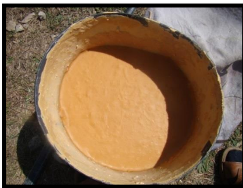
تصویر ۲. لورئین

آبی که از لور خارج می شود را به مدت پنج ساعت می جوشانند تا غلیظ و عسلی شود. این آب قوام یافته لورئین (تصویر ۲) نام دارد که به دو صورت می توان از آن در تهیه چیکو (تصویر ۳) استفاده کرد: