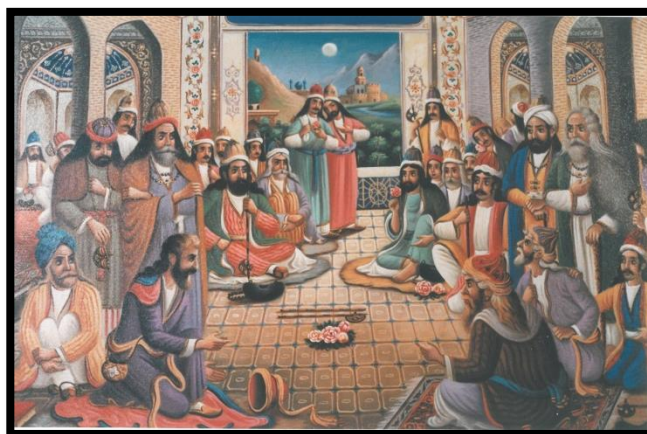
تصویر ۲. قهوه‌خانه سنتی (اثر محمدرضا حمیدی)

صفویه بسیار مهم و مجلل بوده‌اند، به گونه‌ای که حتی پادشاهان نیز به آنجا رفت و آمد داشتند و برای این منظور هر قهوه‌خانه دارای یک غرفه بزرگ به نام شاه‌نشین بود. در سیاحت‌نامه شاردن می‌خوانیم که «قهوه‌خانه عبارت از تالارهای بزرگ، وسیع و بلند و به صور و اشکال گوناگون است که معمولاً بهترین پاتوق هر شهری به شمار می‌رفت، چون مرکز اجتماع و محل تفریح سکنه بلاد می‌باشد. با آغاز روز این مراکز افتتاح می‌یابد و طرف غروب بر تعداد اجتماع افزوده می‌شود، در قهوه‌خانه‌ها مردم به صحبت می‌پردازند و خبرهای تازه مطرح می‌گردد و مردم با کمال آزادی و بدون هیچ‌گونه نگرانی از حکومت انتقاد می‌کنند و حکومت نیز از گفتگوی مردم نمی‌ترسد.» (شاردن، ۱۳۴۵: ۱۱۹)