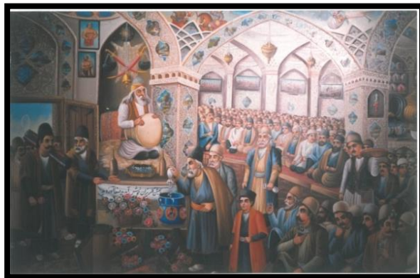
تصویر ۳. تابلوی گل‌ریزان در قهوه‌خانه سنتی (اثر محمد حمیدی)

از اواخر حکومت صفویه به بعد وضع قهوه‌خانه‌ها رو به افول گذاشت و حتی حکومت‌ها مانع از گسترش آن شدند؛ چرا که قهوه‌خانه‌ها مرکز اجتماع و محفل مردم کوچک و بازار و تجارت و کسبه شده بود و صاحبان این اماکن در نظر مردم اعتبار و حیثیتی داشتند.