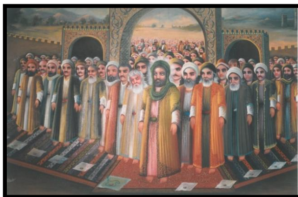
تصویر ۴. تابلوی نماز باران (اثر محمد خلیلی از نقاشان دوران معاصر)

قهوه‌خانه‌ها در دوران صفوی بیشتر به تالارهای هنری و ادبی شبیه بوده است تا به مکانی فقط برای نوشیدن قهوه یا چای، این برداشت از آنجا به دست می‌آید که طبقات مختلف مردم از اعیان و رجال دربار و سران قزلباش تا شاعران و اهل قلم و نقاشان و معرکه‌گیران برای گذراندن وقت به آنجا می‌رفتند و ضمن دیدار دوستان، خود را به بازی‌های مختلف یا مناظرات شاعرانه و شنیدن اشعار شاهنامه و حکایات و قصص و تماشای رقص‌های گوناگون و بازی‌ها و تفریحات دیگر سرگرم می‌ساختند.