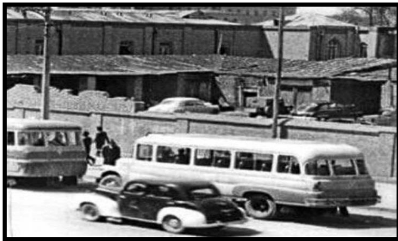
تصویر ۱.

ترانه در تعریف اصلی، به عبارات عاشقانه، غزل و تصنیف‌هایی که طبقات عام جامعه می‌ساخته‌اند، اطلاق می‌شود. ملک‌الشعراى بهار در بحث سبک‌شناسی موسیقی می‌نویسد: «عقیده من این است که عرب وقتی که به ایران آمد تنها از تمام اجناس موسیقی و شعر فقط از این جنس (یعنی ترانه) خوشش آمد و آن را دنبال کرد و شعر عرب از آن بیرون آمد.» (گلبن، ۱۳۷۱: ۷۰) همچنین در ادامه مطلب اظهار می‌کند که: «ترانه بیشتر جنبه موسیقایی و آواز داشته و گفتن و نواختن آن، عام و شنیدن آن، ویژه طبقات اجتماعی فرودست بوده است.» (همان: ۱۲۶)