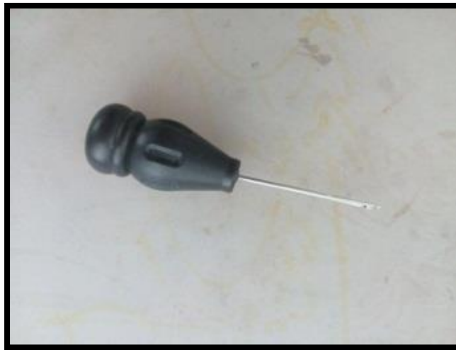
تصویر ۵. بیز یا درفش