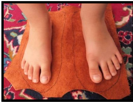
تصویر ۶. مشخص کردن اندازه چرم آماده زیر پا

ساختن چاریق مراحل مختلفی دارد که به ترتیب باید طی شوند: بعد از تهیه چرم و دباغی، چرم آماده زیر پا ۱ پهن می‌شود و استادکار اندازه پا را در حدود دو سانتیمتر بزرگ‌تر دور تا دور با قلم مشخص می‌کند. بعد از مشخص شدن اندازه چاریق، آن را با قیچی آهنی برش می‌دهند. (تصویر ۶)