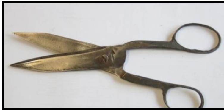
تصویر ۴. قایچی یا قیچی آهنی

چرم و دوخت و دوز کفش استفاده می‌کنند. کفشگران به وسیله درفش، چرم را سوراخ یا سوراخ‌های موجود را بازتر می‌کنند تا بتوانند از آن نخ و سوزن بگذرانند. نوک درفش ممکن است راست یا کمی خمیده باشد؛ نوک میله آن هم اغلب به پهنای ۲ میلی‌متر به صورت تیغه است. (تصویر ۵)