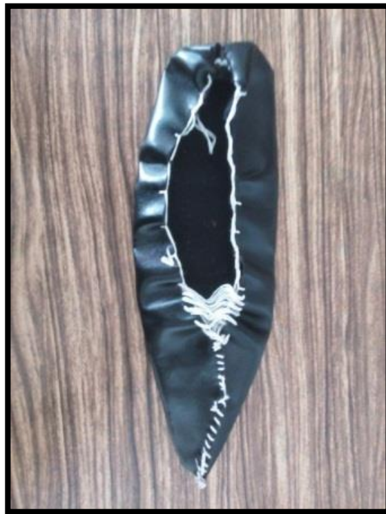
تصویر ۹. چاریق از جنس لاستیک مصنوعی

بعد از این مراحل، نوبت به باغلیق چاریق می‌رسد. باغلیق را از الیاف طبیعی درست می‌کنند که دور تا دور چاریق از لای شیری‌ها و بندهای چاریق رد می‌شود و هر دو سر آن به صورت آزاد در پاشنه چاریق رها می‌شود. طول رها شده این بند تقریباً ۲۰ تا ۴۰ سانتیمتر است. کاربرد این بند آزاد برای جمع کردن دهانه به نسبت گشاد چاریق و محکم کردن آن در پاست. بعد از جمع کردن، این بند را در جلوی ساق پا محکم می‌بندند تا چاریق هنگام دویدن یا پریدن از پا خارج نشود. امروزه به دلیل دشواری در تهیه الیاف طبیعی، از الیاف مصنوعی استفاده می‌کنند. (تصویر ۹)