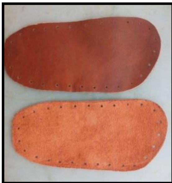
تصویر ۷. برش چرم زیر پا