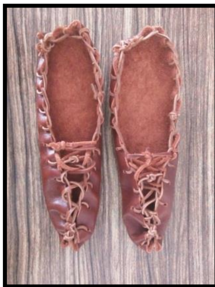
تصویر ۸. نمونه چاریق دست‌دوز آئنی مشکین شهر