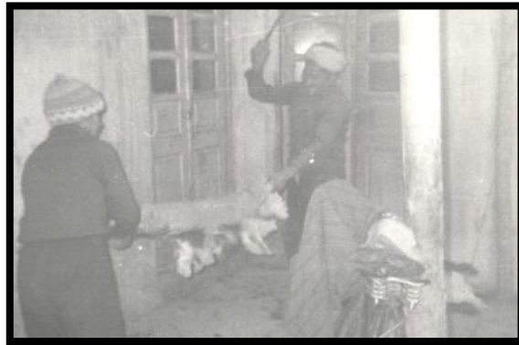
تصویر ۱. چوب‌زدن پشم و پوست در کارگاه‌های پوستین‌دوزی

از آنجا که کار پوستین‌دوزی به دو بخش نشسته و سرپا تقسیم می‌شود؛ از ایوان یا پشت‌بام کارگاه‌ها برای کارهای سرپایی از نوع چوب‌زدن بر پشت کار استفاده می‌کنند البته گاه حیاط کاروانسرا یا کارگاه نیز برای انجام این کار مورد استفاده قرار می‌گیرد؛ چنان که پای به هر کاروانسرای بگذارید، همه جا آثار خشت‌زدن و چوب‌زدن را می‌بینید. (تصویر ۱) در بیشتر کارگاه‌ها بوی تند پشم و غبار غلیظ پوست، بینی و سینه را آزار می‌دهد؛ همچنان که بی‌آفتابی و کم‌نور بودن اتاق‌ها همه جان و تن را.