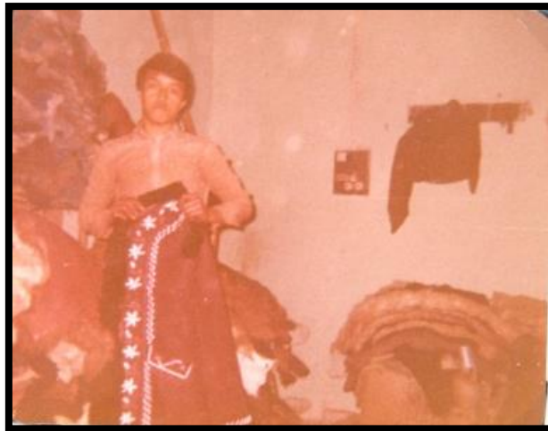
تصویر ۵. محصولات پوستی

وقتی پوستین‌ها برای فروش آماده شد، آنها را تک به تک به دیوار می‌آویزند و با شانه‌های فلزی به بخش پشم می‌زنند تا پیرایش آن زیبایی خاصی پدید آورد.