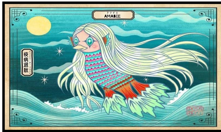
تصویر ۱. اسطوره ژاپنی آمابی

در این بخش نگاهی به کاربرد اسطوره و افسانه در زمان گسترش کرونا در دنیا انداخته‌ایم. ژاپنی‌ها برای مبارزه با کوید ۱۹، ضمن اتخاذ تدابیر بهداشتی، از اسطوره‌هایشان بهره گرفتند، به این ترتیب که در دوران شیوع کرونا، تصویر موجودی دریایی به نام «آمابی» ۱ را میم اینترنتی ۲ کردند. این موجود با سری شبیه پرنده، بدنی شبیه ماهی و گیسوانی شبیه انسان، اسطوره‌ای است که به قرن ۱۹ ژاپن بازمی‌گردد. وزارت بهداشت ژاپن پیام‌های سلامت خود را مانند: «مانع از گسترش ویروس شویم» به همراه تصویر زیر که تصویر آمابی است، منتشر کرد.